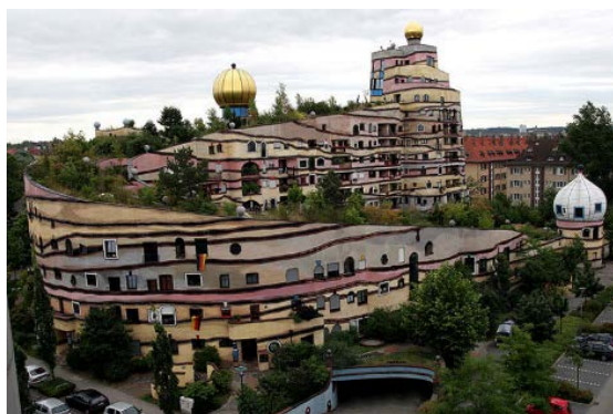
集合住宅『森のうずまき』

学術都市 ダルムシュタット には、多くの大学や研究機関、研究所があり、3万人を超える学生たちが暮らしています。ユーゲントシュティール(ドイツ語圏の世紀末芸術スタイル)の中心地としても知られており、エルンスト・ルートヴィヒ大公が芸術家を招いて創ったマチルダの丘の芸術家村も有名です。ここを中心に、市内には園舎のデザインの参考になる独特の雰囲気をもつ建造物が点在しています。フンデルトヴァッサーが設計した森のうずまきという名の集合住宅は、木や草の生えた屋上が螺旋状に最上階まで続いています。