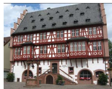
ゴルトシュミーデハウス

ハーナウ は、ブレーメンの音楽隊、赤ずきん、ヘンゼルとグレーテルなどのグリム童話で知られるグリム兄弟が生まれたメルヘン街道の起点のまちです。メルヘン街道は、ここからグリムゆかりの都市を巡り北のブレーメンまで続いています。まちの中心の市庁舎前広場には、大きなヤーコプ・グリムとヴィルヘルム・グリムの兄弟像が建てられています。ハーナウはまた宝石、貴金属の加工でも知られており、市内には木組みの建物が美しい宝石細工の博物館 ゴルトシュミーデハウス (金細工の家)があります。