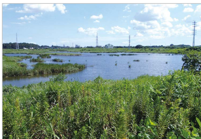
芝川第一調節池（事業地：埼玉県さいたま市・川口市）

持続可能で美しい地域づくり、国づくりに向け、平成 29 年度の予算に関して、防災・減災、地方創生にも貢献するこうしたグリーンインフラの取組に、多くの予算がつけられることを要望 いたします。