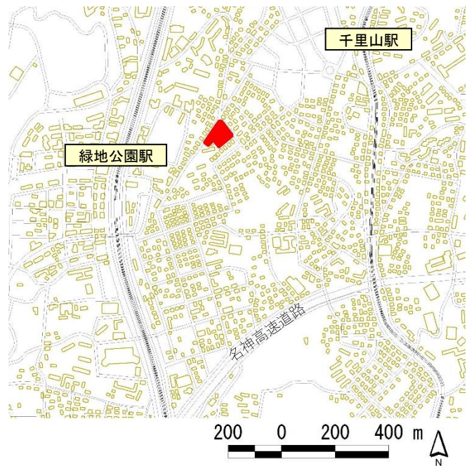
評価対象事業の位置

一律に整枝・剪定を行うのではなく、中高木類を中心に樹高 7～12mまで成長させていくという方針を設け、植栽管理にあたっています。