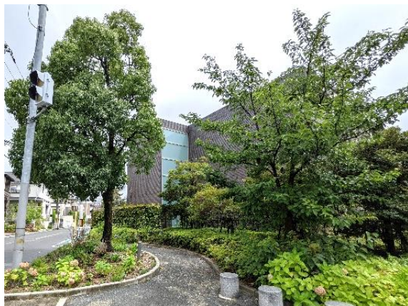
グランカーサ緑地公園 自主管理公園