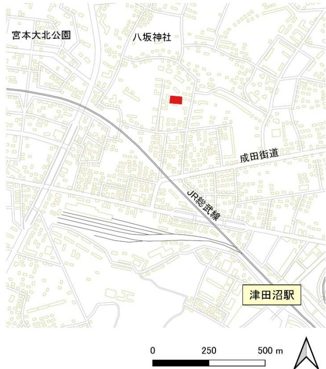
評価対象事業の位置

コナラ、シロダモ、エゴノキ、イロハモミジなどからなる自主管理公園が設置され、里山の風景の再現を目指しています。また、隣接した「ヒューリックレジデンス津田沼」との一体的な植栽管理が行われています。