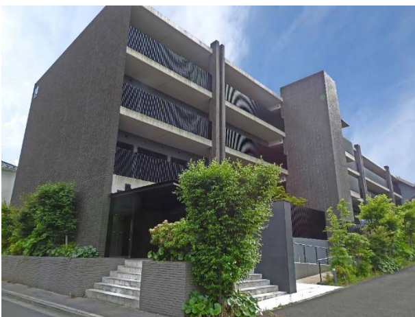
ヒューリックガーデン津田沼の外観