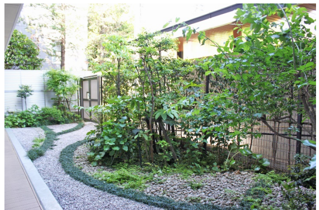
地域本来の植物で四季の潤いを感じられる中庭