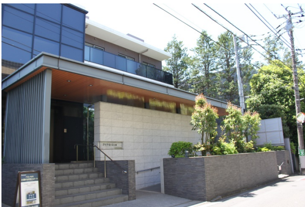
エリア代々木上原の外観