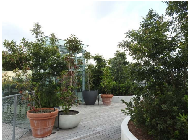
屋上の花壇およびプランター