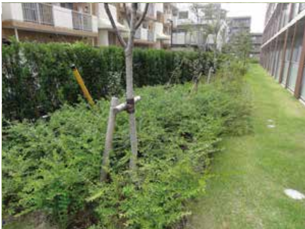
階層構造を意識した植栽