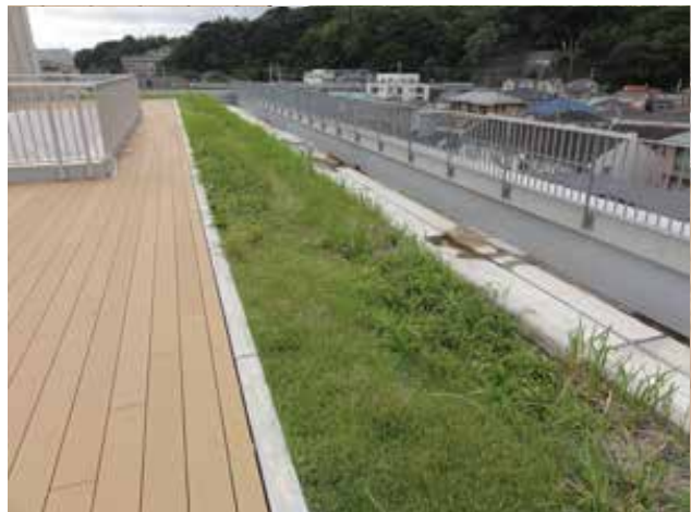
在来草本を植栽した屋上緑化