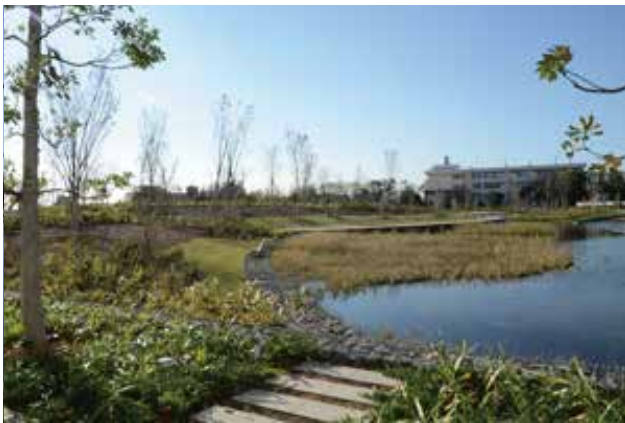
多様な環境が創出された外構