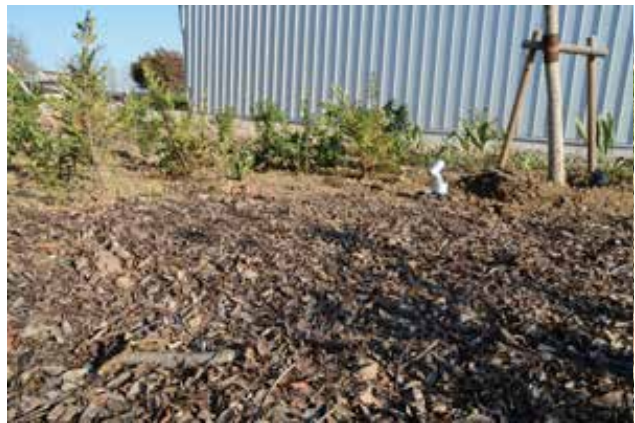
表土の巻き出しの様子