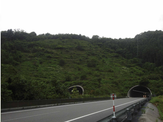
上長山地区の全景