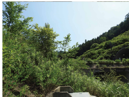
地域性苗木が植栽された区画