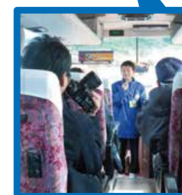
合格率わずか1.6%の非常に難しい検定に合格した優秀な地元の子供ガイド

[往復乗車料金] 大人 320円、大学・高校生 250円、中学生以下 120円 ●バス乗車チケットの提示で、クレインパークいずみ、ツル観察センター入場無料 車内では、出水の歴史や自然に詳しい専門家と、ツルガイド博士検定に合格した子供ガイドがご案内します。